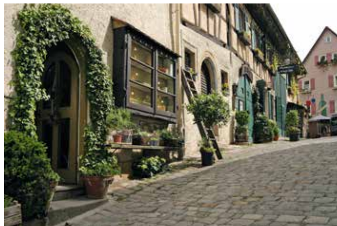
In der Altstadt