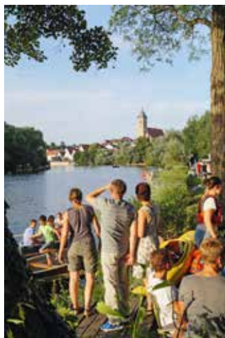
Blick auf Nürtingen