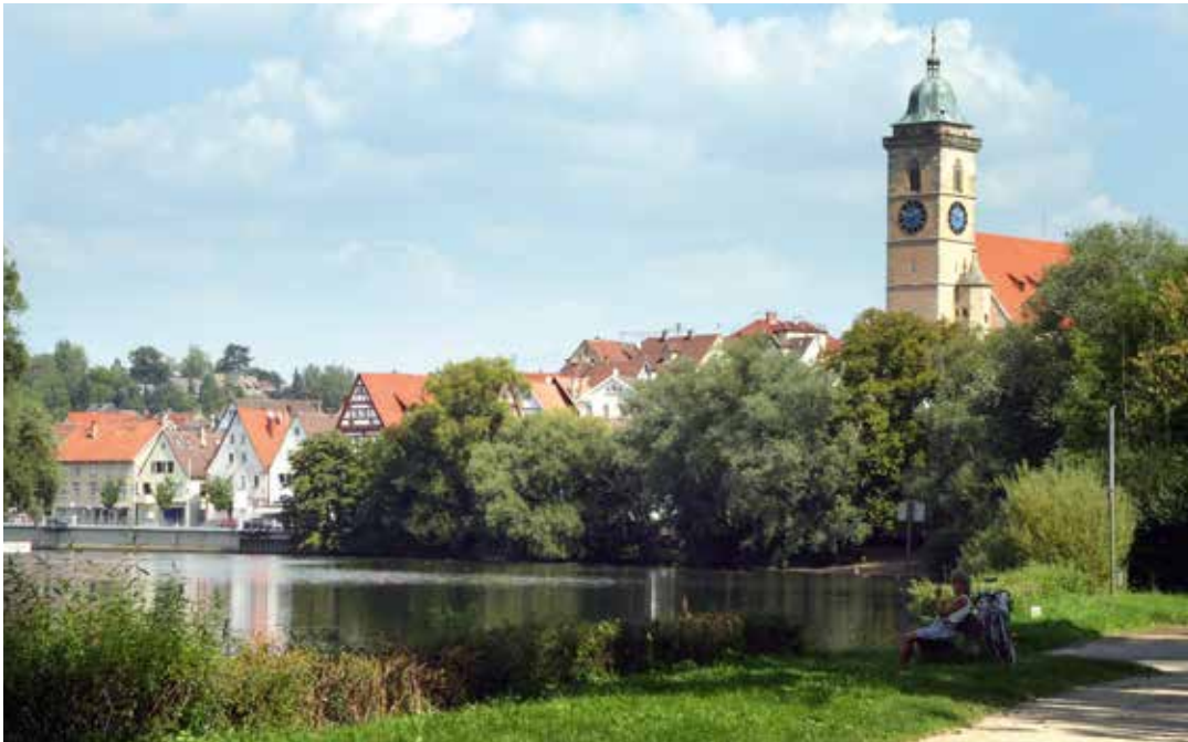
Blick auf Nürtingen