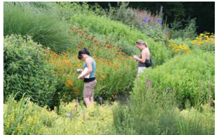
Lehr- und Versuchsgarten Braike „Garten Eden“, Schelmenwasen 6