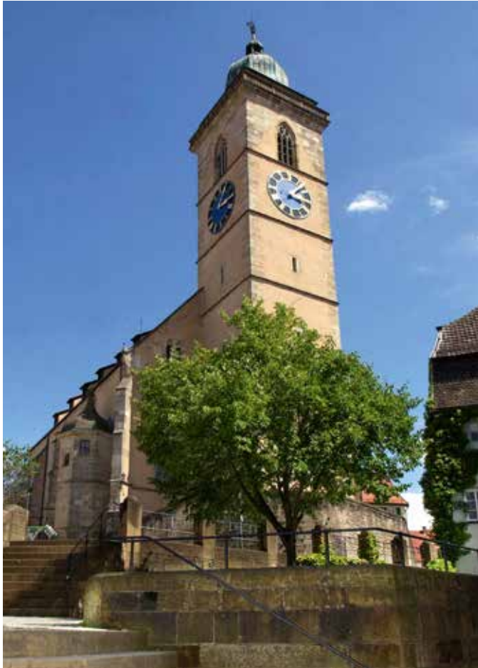
Stadtkirche Sankt Laurentius