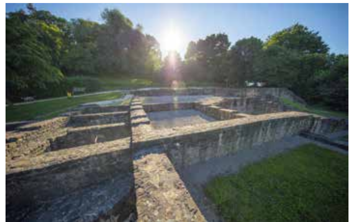
Ehemaliger römischer Gutshof (Villa rustica) in Oberensingen