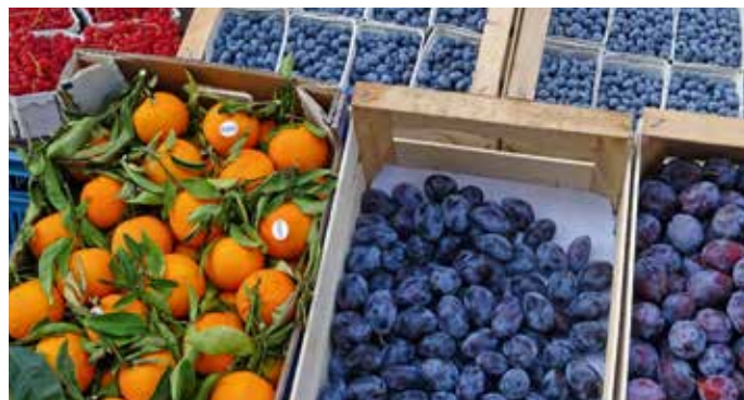
Auf dem Markt