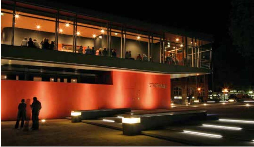
K3N - Stadthalle