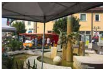
Markt in Nürtingen