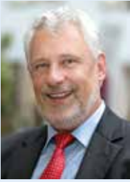
O. Heirich, Oberbürgermeister